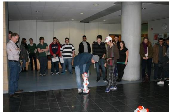
Vorführung der NAO-Roboter