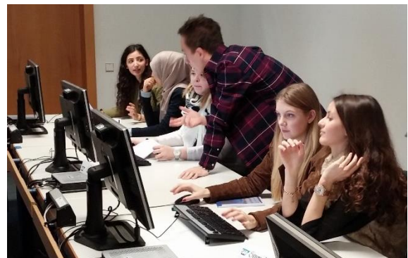
Übungsphasen mit Unterstützung eines Studenten